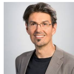
Rolf Mienkus Insel-projekt.berlin UGmbH